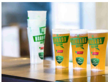
Le rugby s'essaie aux éco-cups

Pour remplacer les gobelets jetables destinés aux sportifs, vous pouvez les inviter à venir avec leur propre gourde (ou proposer des gourdes non datées et consignées) ; mettre en place des gobelets réutilisables consignés (prévoir éventuellement des porte-gobelets) ; ou encore installer des fontaines ou rampes à eau . Pour le public accueilli lors de l'événement, les espaces buvettes des stades et complexes sportifs peuvent également passer aux gobelets réutilisables consignés... La bière d'après-match sera elle aussi zéro déchet ! L'ensemble des éléments de vaisselle existe en réutilisable : à l' achat ou à la location , notamment auprès de votre collectivité.