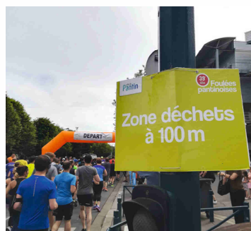
Zone « déchets » en vue lors des Foulées pantinoises de 2018

L'optimisation du système de tri se fait en 4 étapes : identifier le service de collecte et de traitement des déchets, qui peut être public (avec le reste des ordures ménagères) ou assuré par des prestataires privés. Choisir les réceptacles adéquats (matériau, forme, couleur) afin de faciliter l'adhésion des usagers (pensez aux sacs poubelles transparents qui facilitent le contrôle). L'emplacement est aussi un facteur de réussite très important : au départ et à l'arrivée d'une course, à chaque ravitaillement ou espace buvette, dans les gradins pour le public, etc. Les poubelles doivent être visibles de loin et accessibles sur le parcours des sportifs.