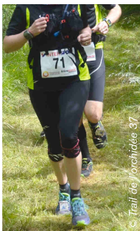
Un chrono zéro déchet grâce à ses lacets!

Vous pouvez choisir des puces, s'attachant aux lacets de chaussures . Ces systèmes,